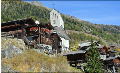
Blatten - Gemeinde des Projektperimeters